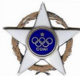
Stella d' Argento CONI al merito sportivo