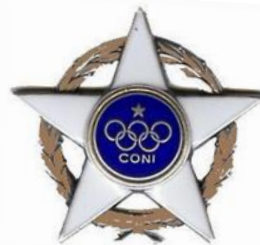
Stella d' Argento CONI al merito sportivo